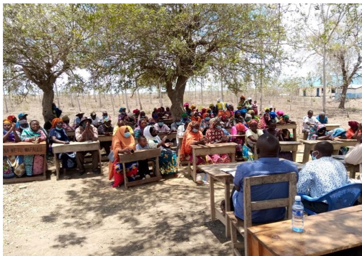
Overleg in de bakkende zon