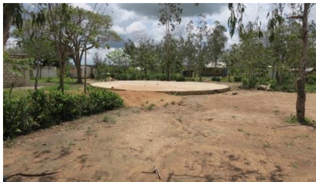
Voormalige 'shade' bij de school in Kasemeni

De shade van de school in Kasemeni is een aantal jaren geleden door een storm kapotgewaaid en moet opnieuw worden opgebouwd.