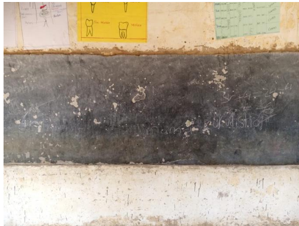
Schoolbord nauwelijks te gebruiken