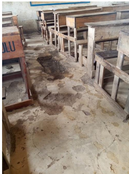
Vloer met gaten

De vloeren van de klaslokalen zijn zeer slecht en hebben gaten. De schoolborden moeten dringend worden voorzien van nieuwe verf. Hetzelfde geldt voor de gebouwen zelf. Er moeten dakgoten worden gerepareerd en de lekkage in de daken moet worden verholpen.